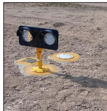
Luz de Protección de Pista Instalada