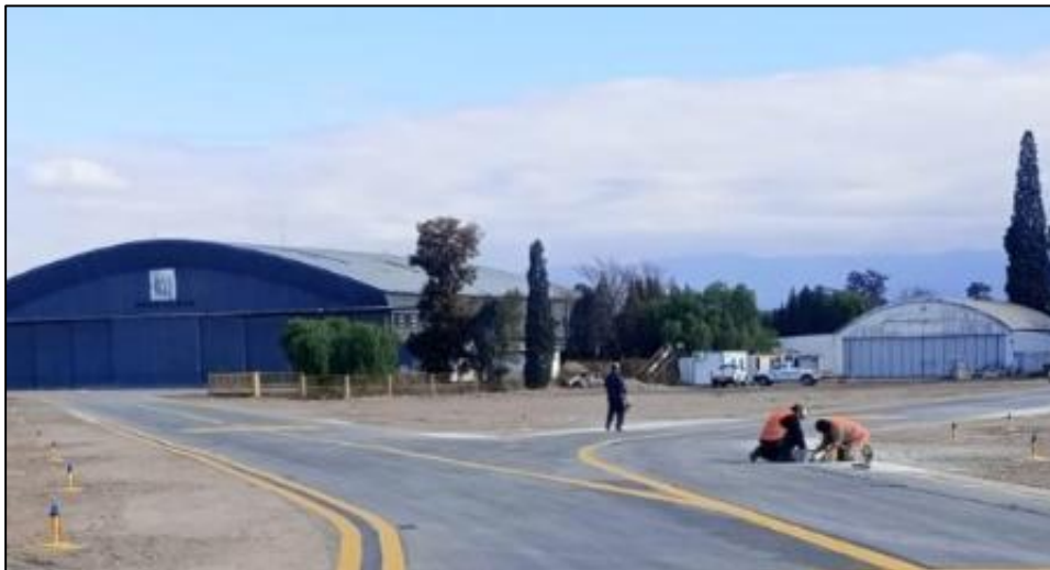
Instalación de luces de borde de rodaje