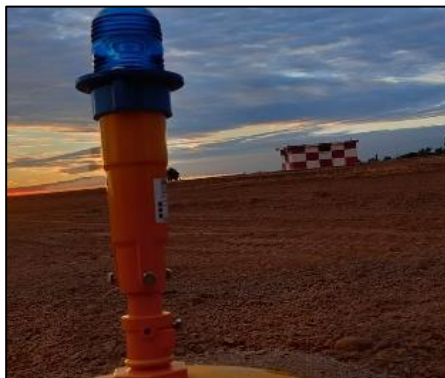
Luz de borde de rodaje instalada