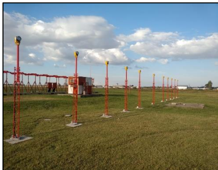
Instalación de luces de aproximación