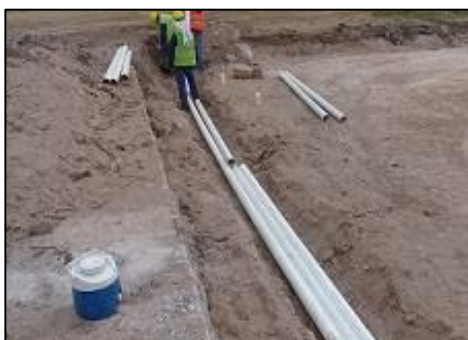
Colocación de caños para acometida secundaria de umbral