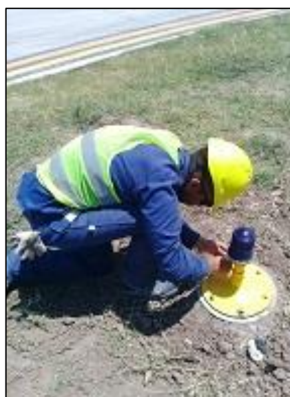
Instalación de luces de borde de rodaje