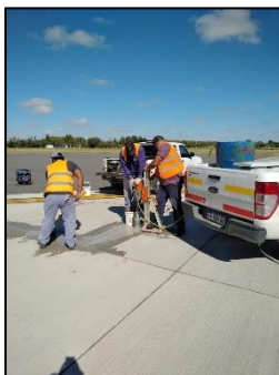
Hollado de pavimento para instalación de balizas empotradas