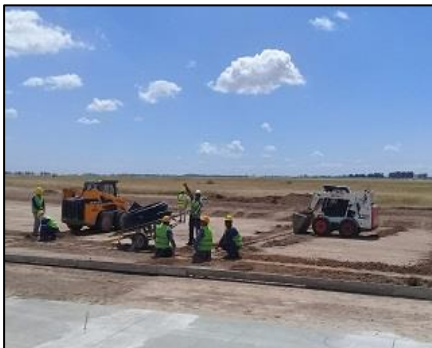
Ejecución de canalizaciones acometidas primarias

Foto del proyecto: Cantidad de Personal: 18