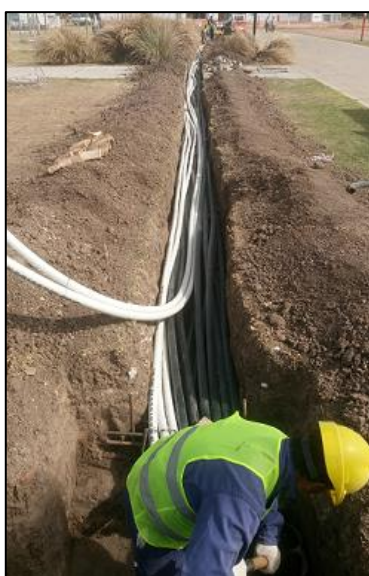
Troncal de balizamiento