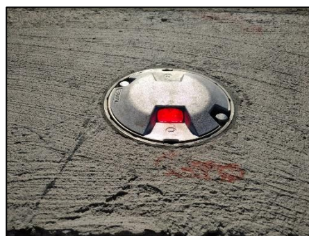
Baliza empotrada bidireccional