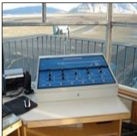
Pupitre de Control Balizamiento