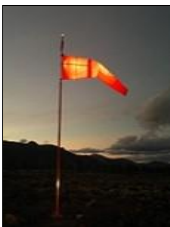
Cono de viento