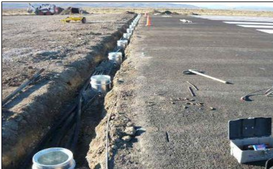
Elaboración de Umbral de Pista