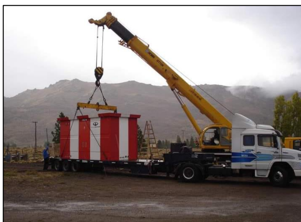
Emplazamiento de edificio Premoldeado.