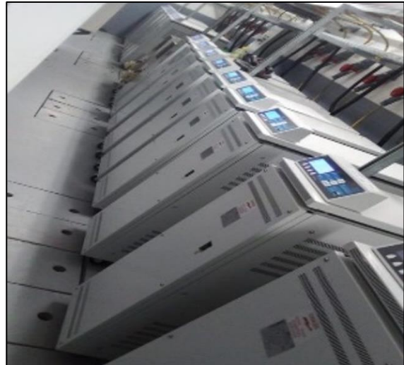
Sala de Reguladores SET Norte