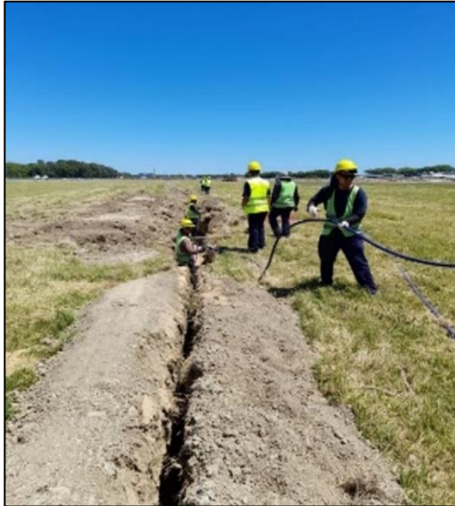
Zanjeado y tendido de cable de MT