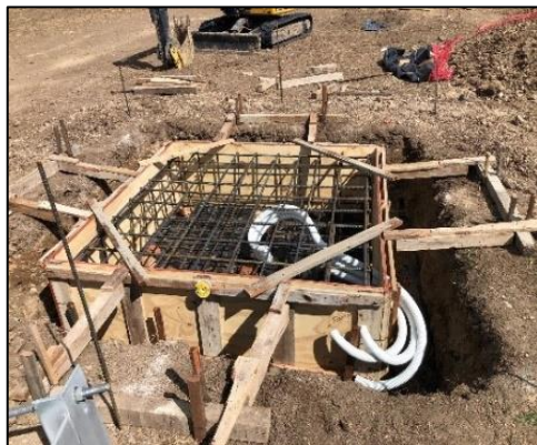
Elaboración de cámara de balizamiento