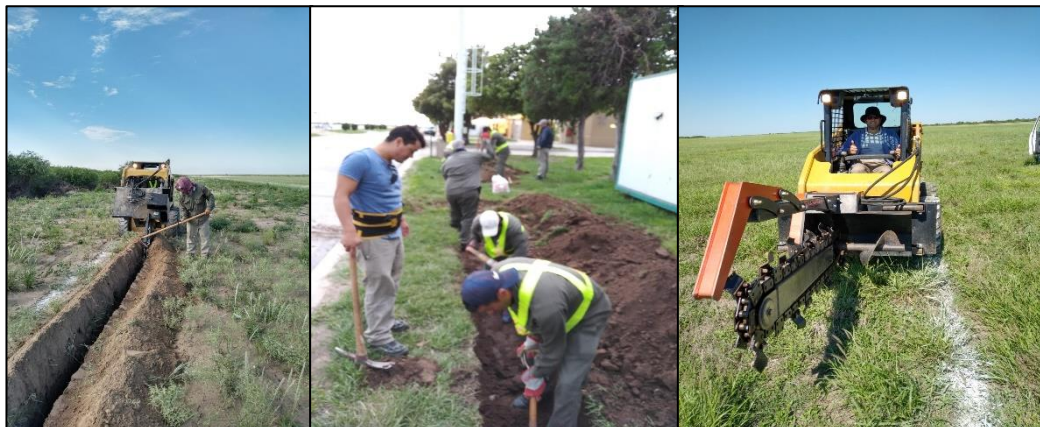
Zanjeado a máquina y manuales para acometidas primarias