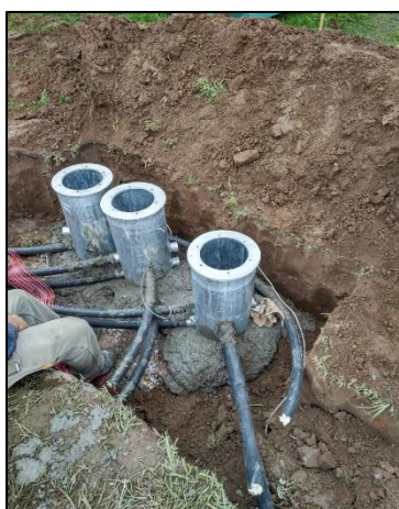
Instalación de bases L-867