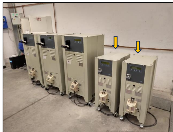
Reguladores de Corriente Constante Instalados