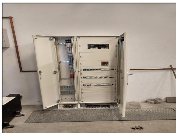
Tablero general de balizamiento