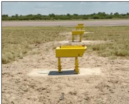
Luces PAPI instaladas