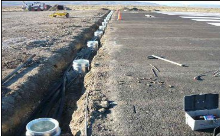
Elaboración de Umbral de Pista